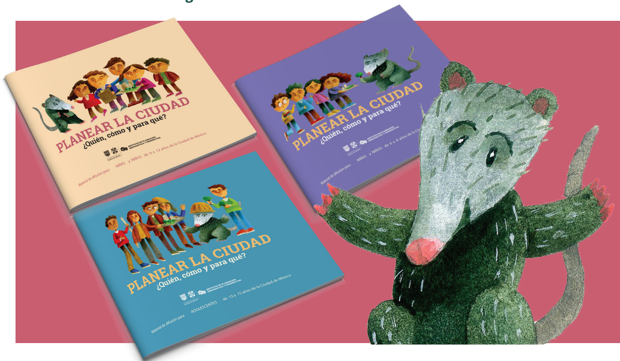
Imagen 1. Versiones de los materiales del IPDP.

Los materiales cuentan también con un personaje que retoma la figura de un Tlacuache, a quién se nombró “Tli, el tlacuache”, como un elemento que permite crear un vínculo entre los NNA y los materiales, que los acompaña en el aprendizaje de los contenidos y en la realización de los ejercicios.