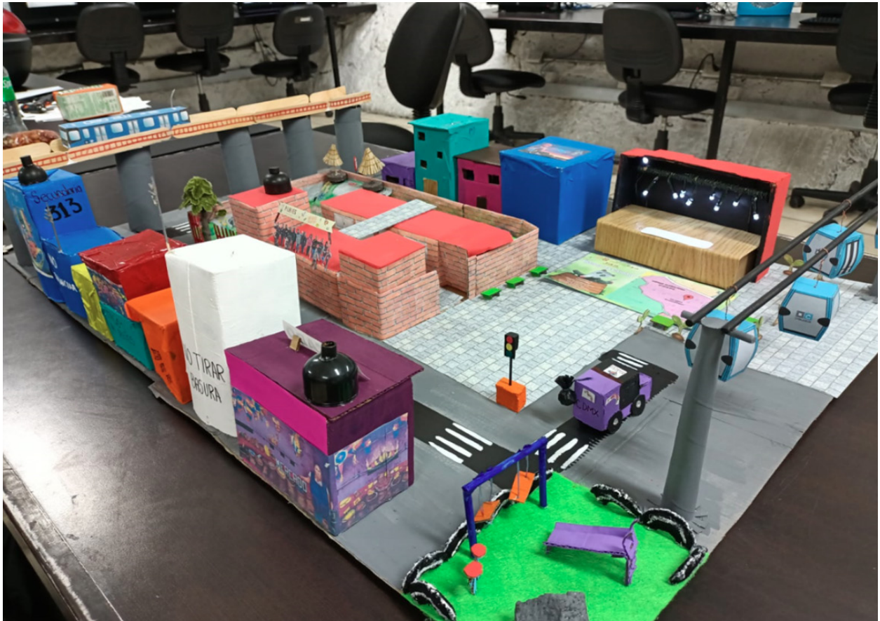
Fotografía 6. Proyecto. Maqueta de asistentes a actividades en la alcaldía Iztapalapa